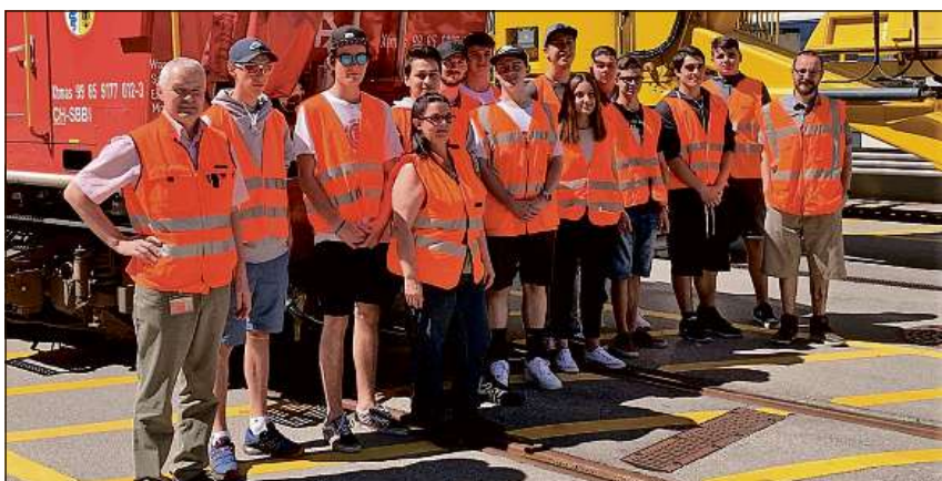
La viseta a Pollegio/Blizuna al portal dil tunnel da basa dil Gottard.

han els saviu far inaga experientscha cun in auter sector tecnic. Suenter quell'orientaziun ei vegniu cuntinuau cul viadi a Locarno-Magadino. Sigl iral da go-kart han ils giuvenils saviu sedivertir. Suenter treis cuorsas ein ils campiuns stai erui ed ein vegni honorai. Mo era il divertiment culinari ha buca muncau quei di. Aschia ein las emprendistas ed ils emprendists returnai plein forza e cun bialas impressiuns e regardientschas anavos a Mustér.