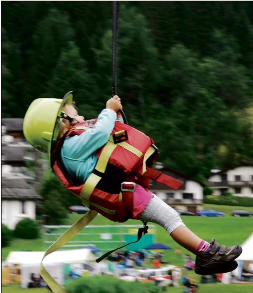
Ina dallas numerusas attracziuns che carmalan. En in tempo snueivel descendan ils affons cun la suga sur il lag ora.