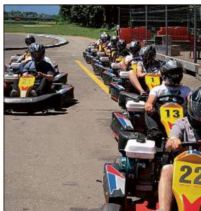
Divertiment sigl iral da go-kart.