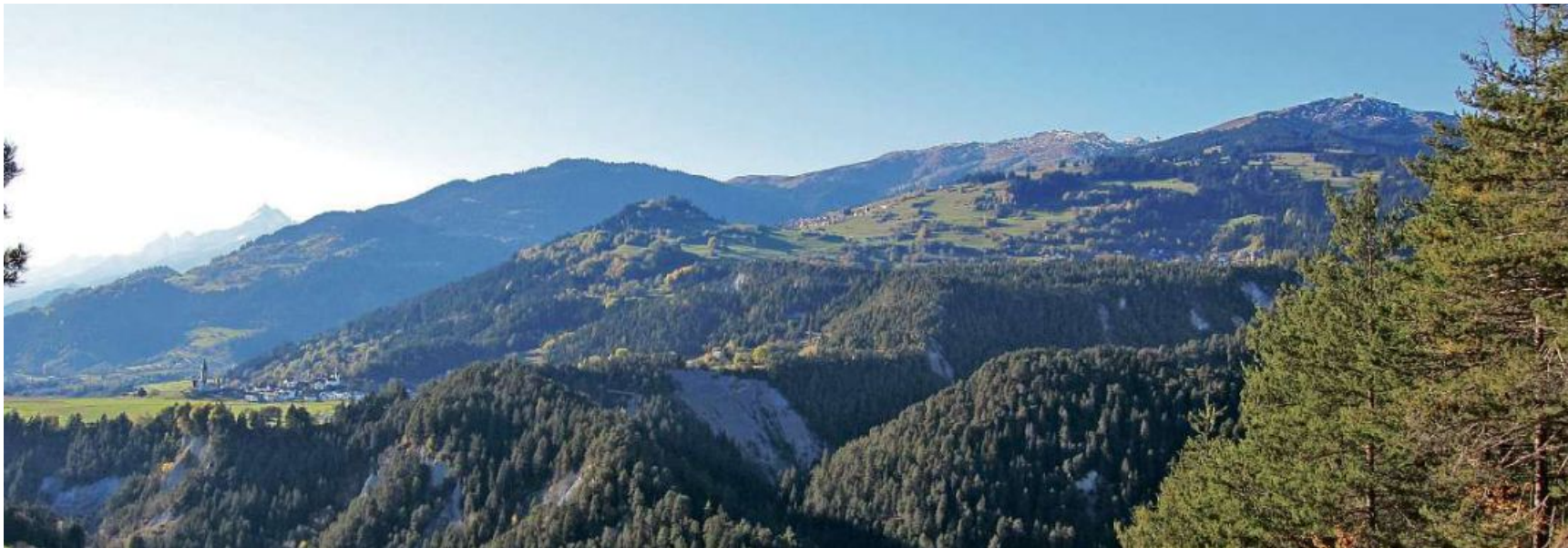
Vesta naven da Valendau encunter la cuntrada dallas quater vischnauncas Schluein, Sagogn, Falera e Laax, enemiez la Mutta da Falera.

Tgei fan ins tier in preproject d'ina fusiun? In niev exempel ella Foppa