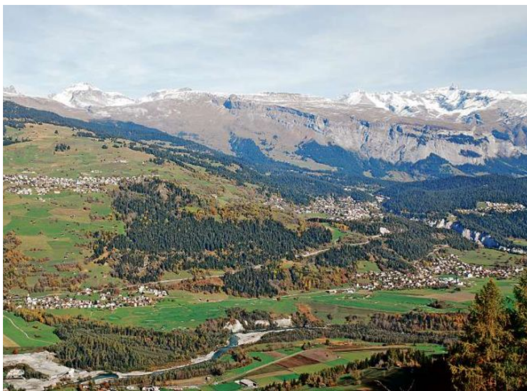
Vesta sil «quaterfegl» Falera, Laax, Sagogn e Schluwein (en direcziun dall'ura).